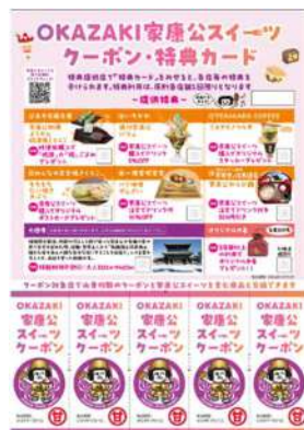
《スイーツめぐりクーポン》