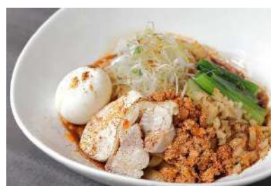
コラボラーメン「汁なし八丁味噌担々麺」