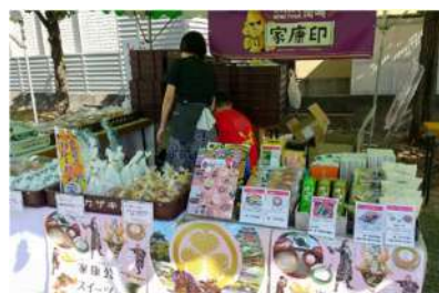
《イベントでの商品販売》