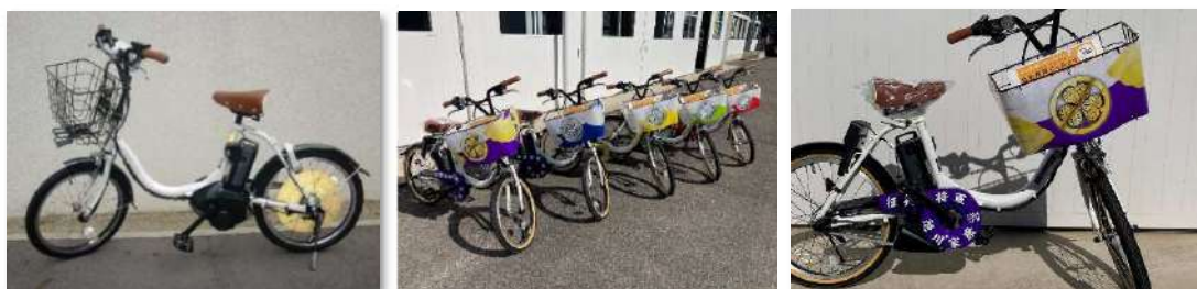
新規投入全50台のうち、ラッピング10台・普通40台