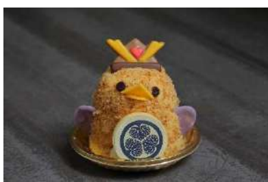
コラボぴよりん「徳川びよ康」